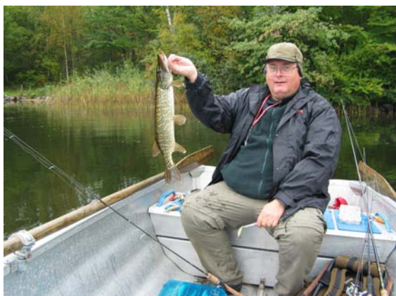
Inga jättegäddor precis men dock fisk