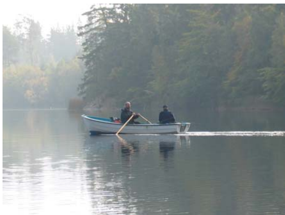
En vacker höstdag