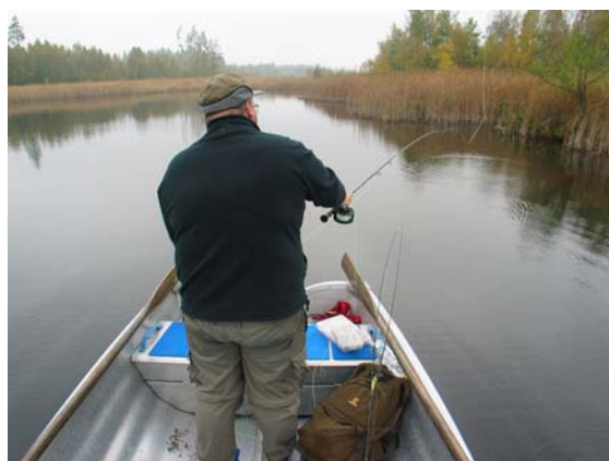
Längst upp i sutarviken

Söndagen börjar som lördagen slutade – dvs. med dimma. Vi kommer igång efter en förstärkt engelsk frukost men det är trögt. Vi går över till flugfiske uppe i den grunda sutarviken med magert resultat.