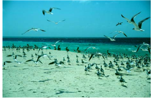
Havsfåglar på Madrisqui

Madrisqui heter den ö som ligger närmast Gran Roque. Du når denna på kanske 5 minuter med båt. Madrisqui är förbunden med grannön Piratas genom ett smalt sund som är vadbart. Madrisqui har fina strandstränder som lockar soldyrkare. Piratas har en stor och fin lagun med blandbotten.