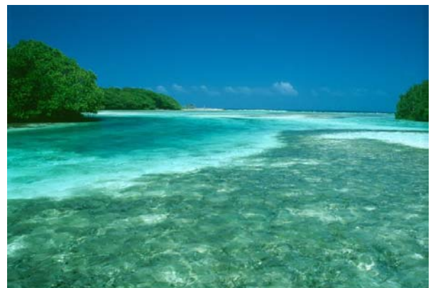
Korallrev och lagun