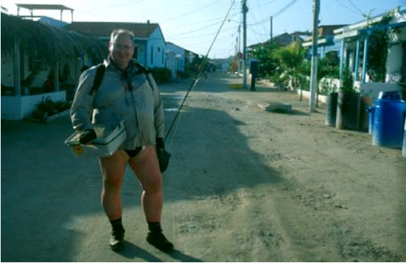
Huvudgatan på Gran Roque