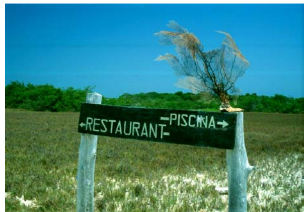
Närmste restaurang och pool är tydligt markerade

Denna ö är den nordligaste i arkipelagen och nås efter 10 minuters färd med taxibåt. Francisqui är ett populärt mål för dagsutflykter, har fina sandstränder där man även hittar en restaurang som serverar mat och dryck mellan ca 11 och 17. Runt Francisqui hittar man fina laguner och rev, samt en naturlig pool strax innanför korallrevet.