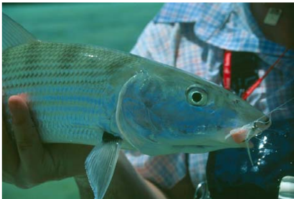
Närbild på bonefish

Utbredningen är tropiska och varma vatten runt Amerika, i såväl Atlanten som Stilla havet. Bonefish hittar man främst runt flats, i mangrove laguner, åmynningar och de djupare vattnen runt dessa. Tack vare en blåsa med en funktion som påminner om en lungas kan Bonefish klara mycket låga syrehalter vilket inte är ovanligt i de miljöer de trivs i. Födan utgörs huvudsakligen av blötdjur och kräftdjur som de krossar med hjälp av benplattor i munnen och på tungan. Jakten pågår ofta på så pass grunt vatten som 30 cm. Under jakten simmar alla exemplar i samma riktning och håller samma konstanta hastighet. Enstaka äldre och större exemplar jagar dock ofta ensamma. Som tidigare nämnt är Bonefish en skygg fisk och det är lätt att skrämna dem.