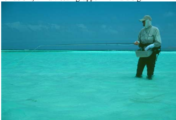
För mycket sol straffar sig

Utöver fiskeutrustningen bör du ha med dig lämpliga kläder som skydd mot den starka solen. Glöm inte solskyddskräm med hög faktor. Solen är otroligt stark och den friska och svalkande passadvinden gör att man inte upplever solen och värmen, mycket förrädiskt, vilka vissa i gruppen fick lära sig.