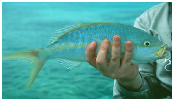
Yellow fin snapper

Under vår vistelse räknade fångade vårt resesällskap sammanlagt 14 olika arter. Bland annat några vackra revfiskar – snappers kallade och meterlånga näbbgäddor grova som handleden.