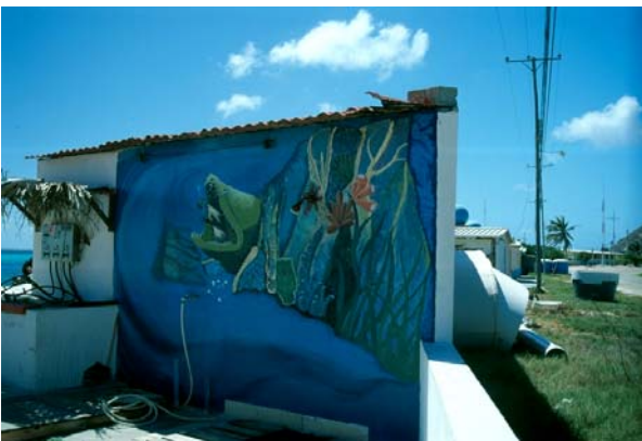
Väggmålningar smyckar ofta ut husen