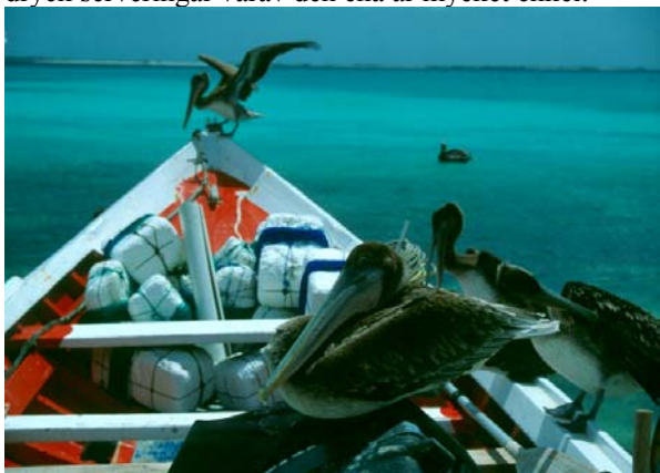
Pelikaner på Crasqui

Crasqui är en långsmal ö som ligger 30-40 minuter från Gran Roque. Färden går över öppet och djupt vatten och turen hem när man går mot sjön kan vara tuff. Läsidan av Crasqui består av en flera kilometer lång sandstrand. Sydöstra spetsen har fina flats och ett långt vadbart rev. Om man letar noga hittar man en stor undanskymd lagun om ett par kvadratkilometer som döljs av mangroven. Crasqui erbjuder två mat och dryck serveringar varav den ena är mycket enkel.