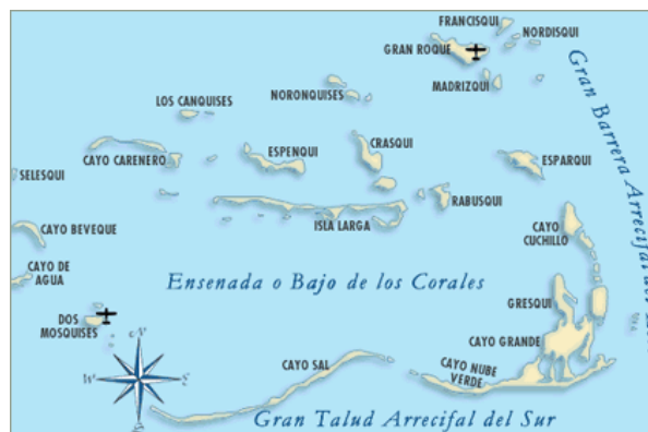
Karta över arkipelagen Los Roques

jul/nyår samt juli/augusti om man tittar till priserna för inkvartering.