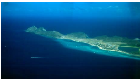
Gran Roque sedd från luften

Vid frukosten får vi sällskap av resten av gruppen, som anlänt mitt i natten efter att KLM bokat om dem via den före detta Nederländska kolonin Bonaire. (Ibland är det klara fördelar med ett stort flygbolag med ett omfattande nät och många anslutningar.) En eloge skall ges till resebyrån som snabbt tog tag i saken och såg till att ringa de telefonsamtal och trycka på de knappar som behövdes. Vid tiotiden hade vi transporterats tillbaka till flygplatsen, checkat in och fyllt i ett frågeformulär inför avfärden till Gran Roque med flygbolaget LTA, Linea Turistica Aerotuy . Det tvåmotoriga planet tar oss till vår destination 170 km ut från kusten på dryga halvtimmen. Drygt halvvägs skymtar vi de första öarna och reven i arkipelagen, som ljusa fläckar mot en marinblå bakgrund. Runt reven och mellan dessa lyser vatten i turkosblått, precis som på vykortet.