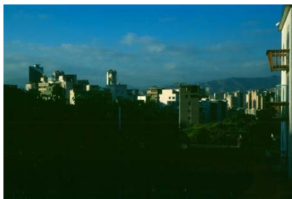
Caracas, utsikt från hotellet